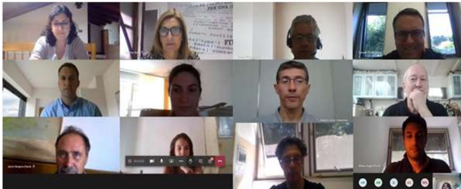
Captura de pantalla de la reunión de socios online.

Por último, se ha celebrado el comité de seguimiento y gestión del proyecto, así como las próximas actuaciones a llevar a cabo en el próximo semestre.